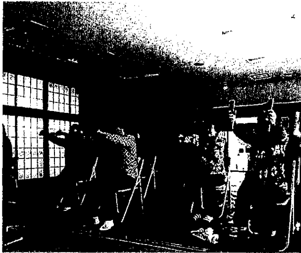
◆始めてみました！（戸塚地区の皆さん）

矢祭町では、いくつになっても住み慣れた地域で、いきいきと生活できるように、身近な場所でご近所さんと一緒にできる「いきいき百歳体操」を平成28年度からすすめていきます。