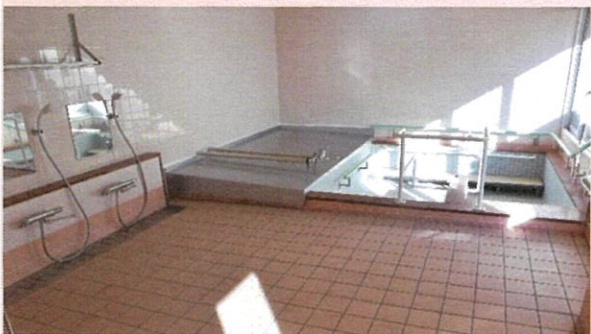
お風呂に入りたいだけでいつも清潔な身体を保ちます。

ユアイホーム「おひさまデイサービスセンター」は、認知症の方のためのデイサービスです。