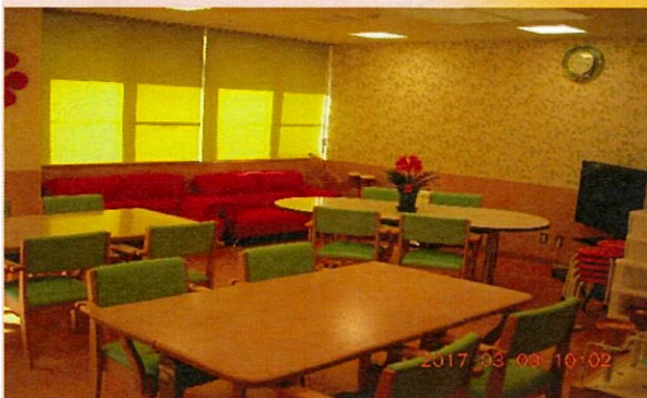
あたたかい雰囲気でお過ごしいただきます。