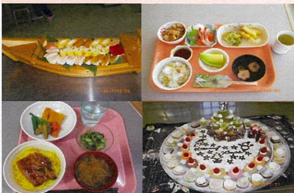
おいしいお食事・安心・安全なおやつで健康をサポートします。