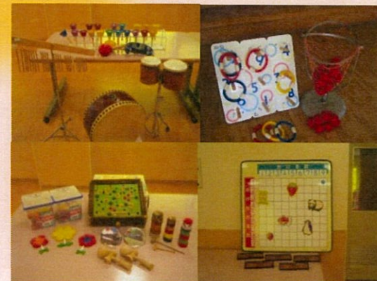
お体に合わせたリハビリプログラムを行います。